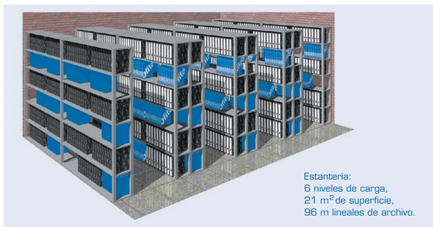
Esteriería: 6 niveles de carga, 21 m 2 de superficie, 96 m lineales de archivo.