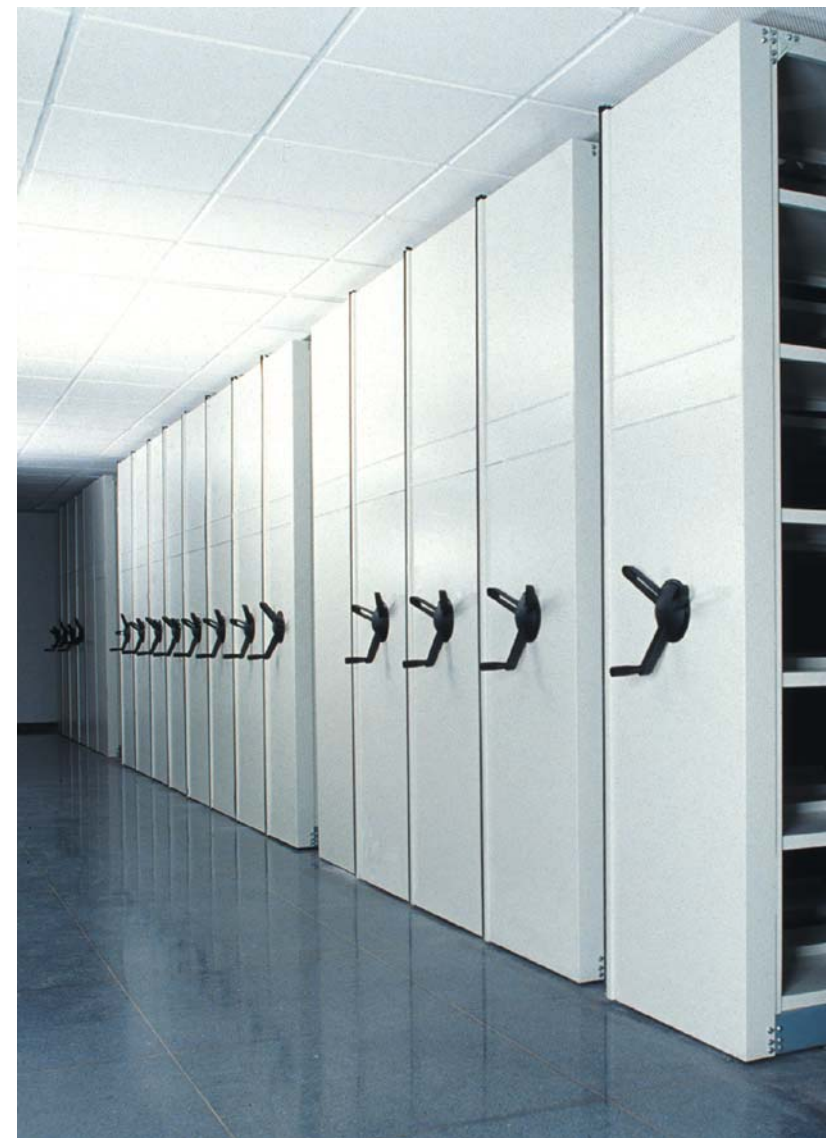
Universidad de Málaga